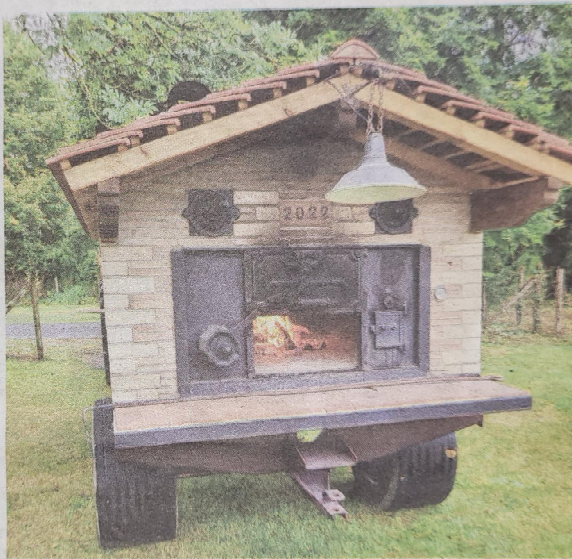
Le four truck a été inauguré le 15 août.